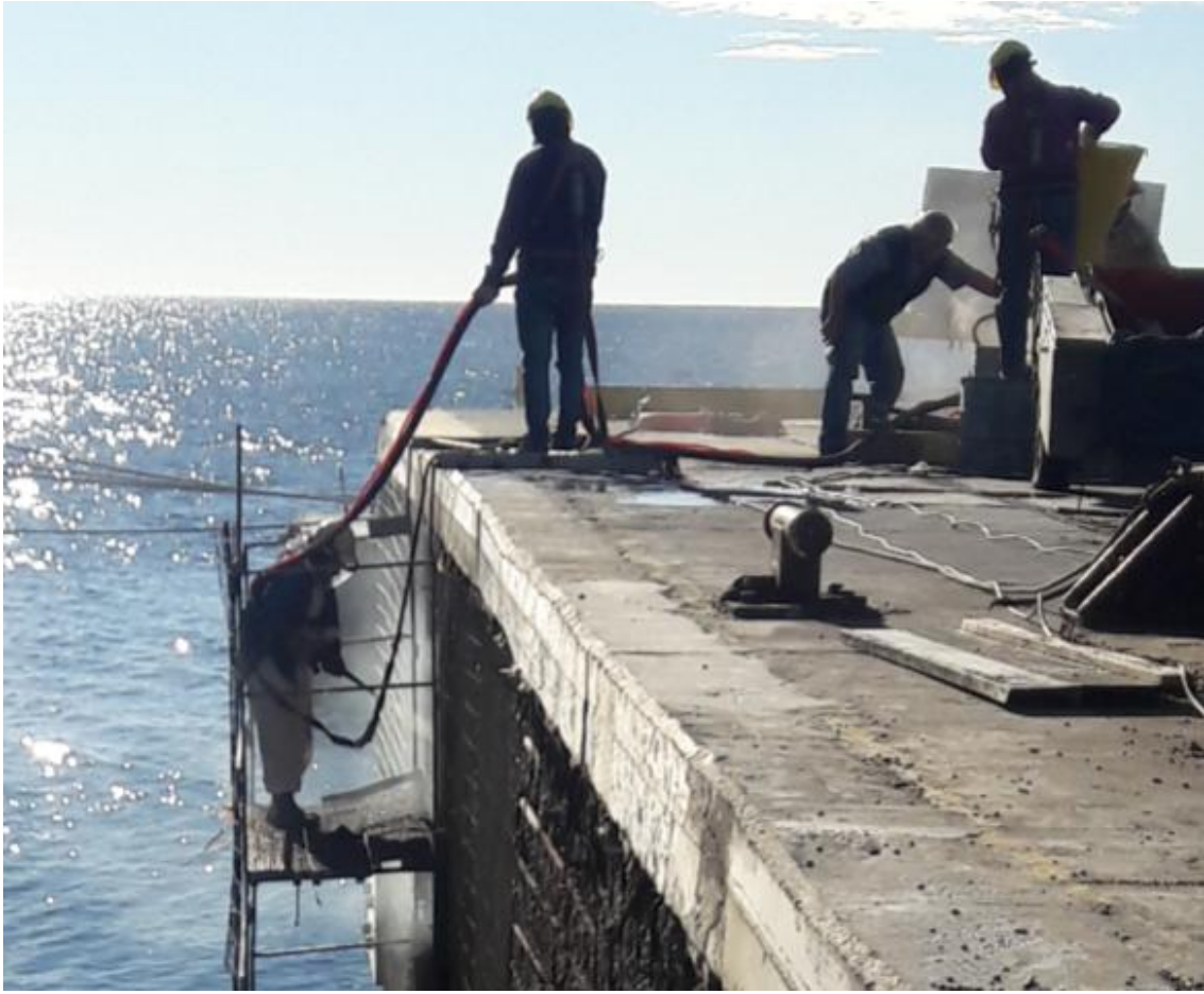
Foto 03 – Cuadrilla de trabajo conformada por un oficial y dos ayudantes.